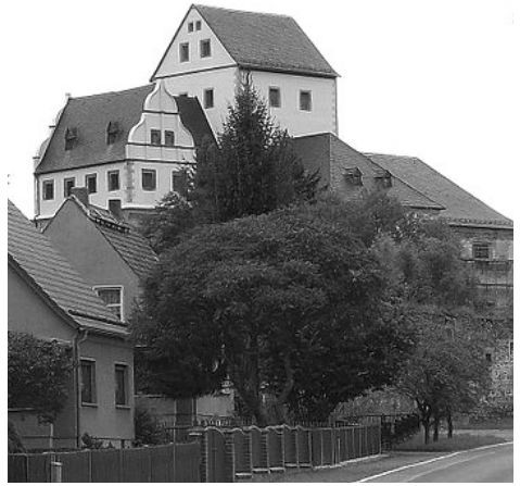
Wünschendorf Elster, Kloster Mildenerfurth

Nach dieser Führung werden wir von Thüringen in die Oberpfalz zum Kloster Speinshart weiterfahren. Das Kloster Speinshart hat eine aktive Prämonstratensergemeinschaft. Wir werden hier eine Führung durch das Klosterdorf erleben.