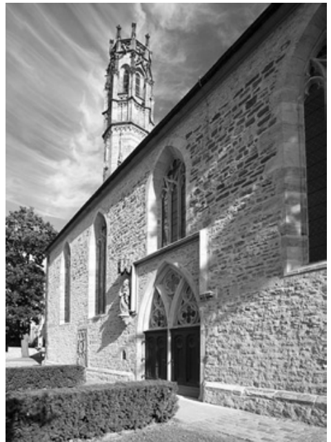
Augustinerklosterkirche in Erfurt

Bei Nichterreichen der Mindestteilnehmerzahl kann die Reise bis spätestens 4 Wochen vor Beginn abgesagt werden.