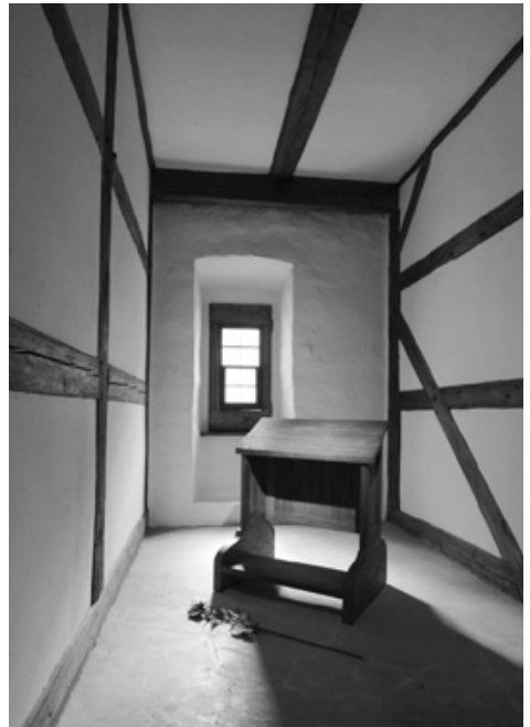
Augustinerkloster in Erfurt, Luther-Zelle

Unser Bus bringt uns anschließend zu unserem Hotel und Restaurant „H + Hotel Erfurt“, wo wir den Tag ausklingen lassen.