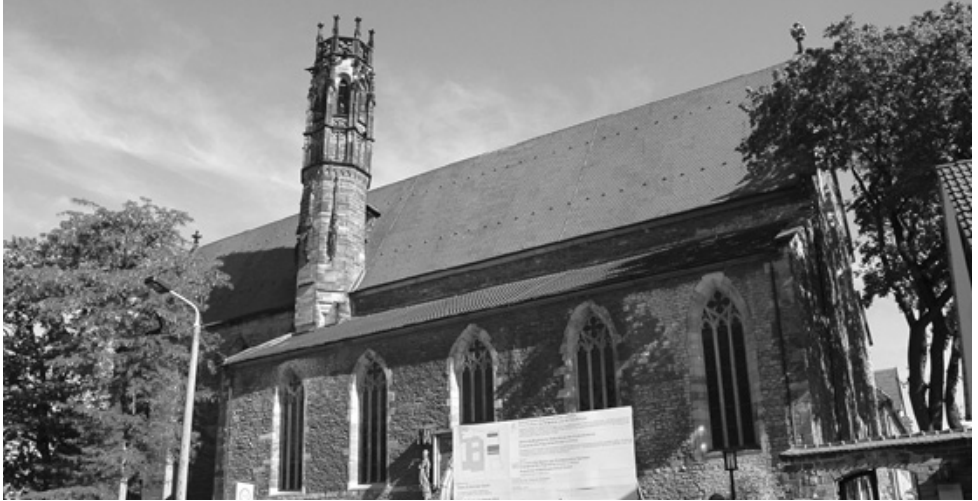
Augustinerkirche in Erfurt