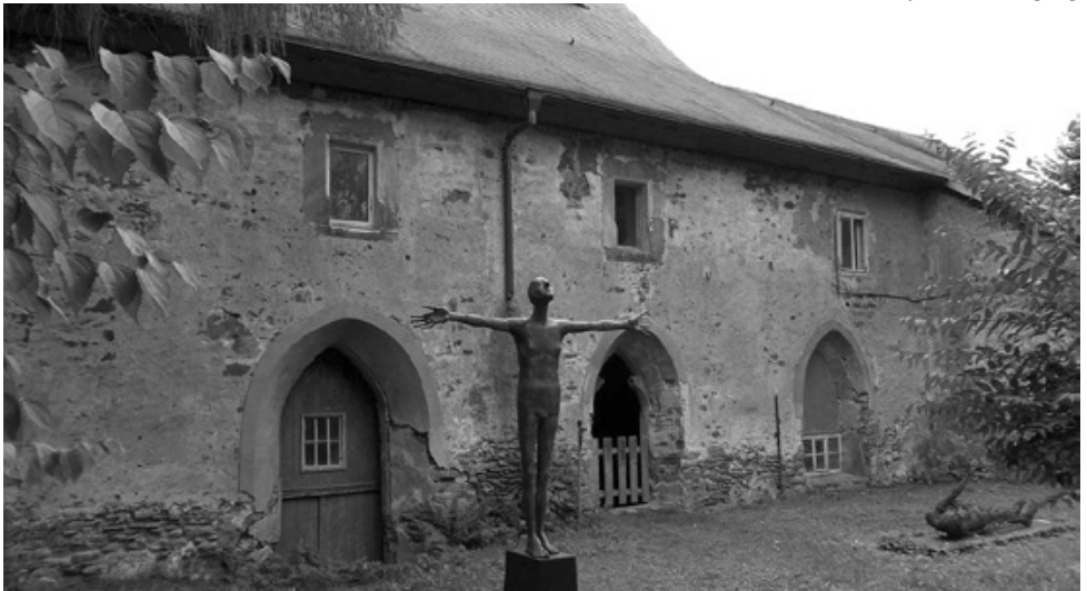
Kloster Mildenerfurth, Kreuzgang

Den Abschluss dieses Tages in Speinshart bildet dann die Vesper im Kreis der Prämonstratenser, bevor wir den Tag im Hotel „Glutschaufel“ in Eschenbach (Oberpfalz) ausklingen lassen.